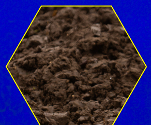
Terre - Boue