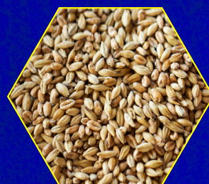
Riz - Céréales